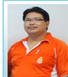
หัวหน้างานกิจกรรมนักศึกษา